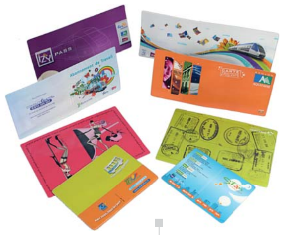
Étuis et Portes Cartes